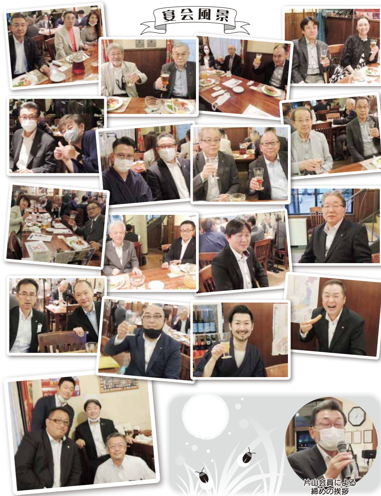
片山会員による 締めの挨拶