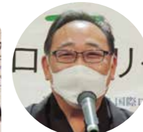
主藤直前会長による締め