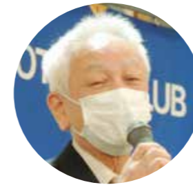
福地会員による乾杯